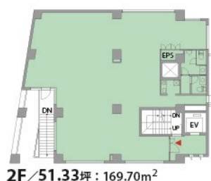
2F / 51.33坪：169.70m 2