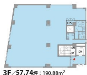
3F / 57.74坪：190.88m 2