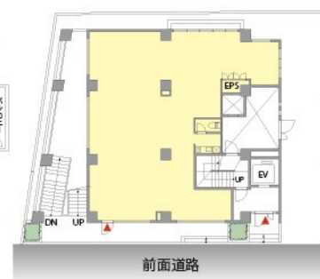
1F / 40.19坪：132.86m 2