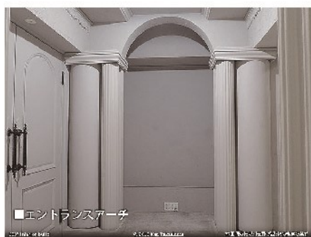
エントランスアーチ

ラグジュアリーで重厚なヨーロッパ調アトリエ アーティストの設計・デザイン・造作による特別仕様 内装費約2千万円・南青山骨董通り沿い