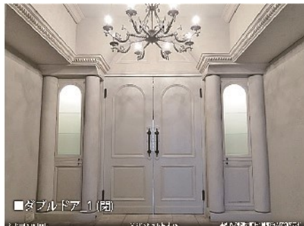
ダブルドア 1 (閉)