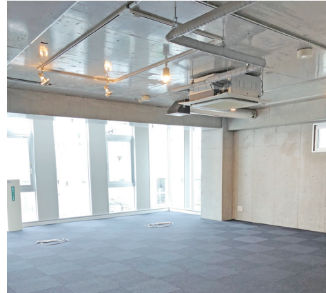
● 図面と現況が異なる場合は現況を優先と致します。