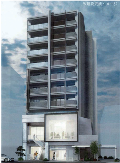
※建物完成イメージ