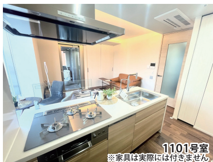
1101号室 ※家具は実際には付きません