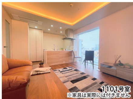
1101号室 ※家具は実際には付きません

賃料／ 343,420円 ：@ 約2.55万円／坪 共益費／ 20,000円 敷金／ 1ヶ月分 礼金／なし 契約期間／ 2年間 更新料／なし