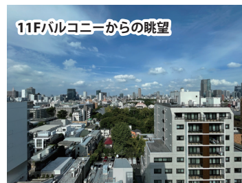
11Fバルコニーからの眺望