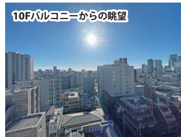
10Fバルコニーからの眺望