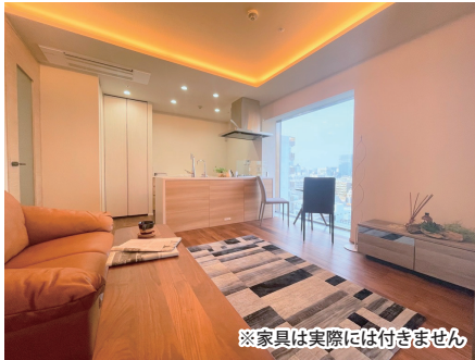
※家具は実際には付きません