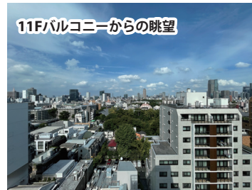
11Fバルコニーからの眺望

賃料／349,960円 共益費／賃料に含む 敷金／1ヶ月分 礼金／なし 契約期間／2年間 更新料／なし