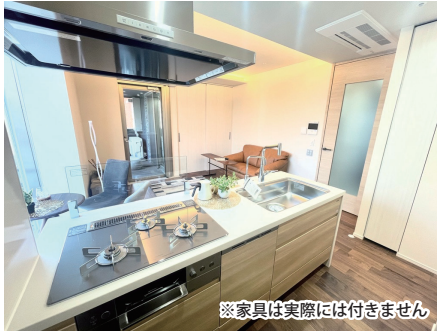
※家具は実際には付きません